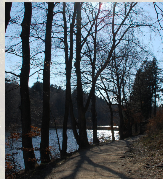
Einst Grubenstandort, heute Naherholungsgebiet: Der malerische Itzenplitzer Weiher in Heiligenwald ist Ziel vieler Wanderer