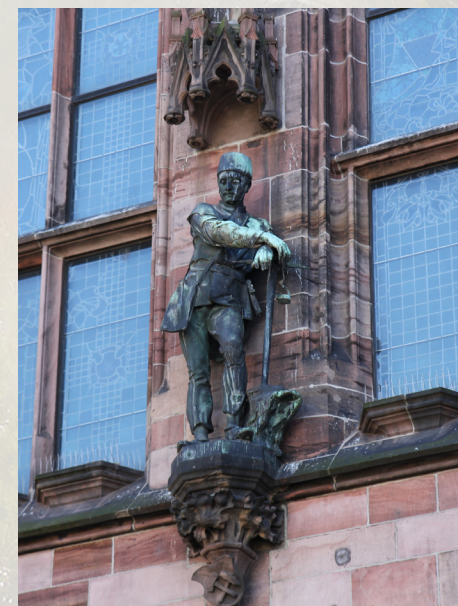
Bergmann an der Fassade des 1900 fertig gestellten neu-gotischen Rathauses Saarbrücken

Duhamel-Schacht umbenannt worden war. Das 1857 gegründete und 1957 der Grube Ensdorf zugeschlagene Bergwerk Griesborn hatte hingegen seine Anfänge in der preußischen Staatsgrube Kronprinz Friedrich Wilhelm, deren Hauptstandort in Schwalbach lag. Zur Erschließung neuer Feldesteile errichtete das Bergwerk Ensdorf zwischen 1982 und 1987 den auf Falscheider Gemarkung liegenden Nordschacht. Durch die Zusammenführung der beiden Bergwerke Warndt/Luisenthal und Ensdorf zu einer organisatorischen Einheit mit zwei Förderstandorten in Ensdorf-Duhamel und auf der Anlage Warndt entstand zum 1. Januar 2004 das Bergwerk Saar. Am 17. Juni 2005 wurde dann die Steinkohlenförderung auf dem früheren Verbundbergwerk Warndt/Luisenthal eingestellt, am 1. Januar 2006 der Verbund West in Gänze stillgelegt. Seitdem stellte das Bergwerk Saar die Fortführung des ehemaligen Bergwerks Ensdorf dar.